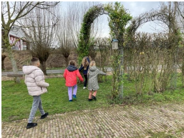
Bezoek gr. 3 HWL, een speurtocht.

Een greep uit activiteiten van de laatste weken, meer foto's op schoudercom!